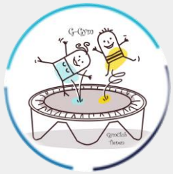
G - GYM

G-Gym richt zich op de motorische ontwikkeling en bewegingspatronen voor kinderen met een verstandelijke beperking (type 2).